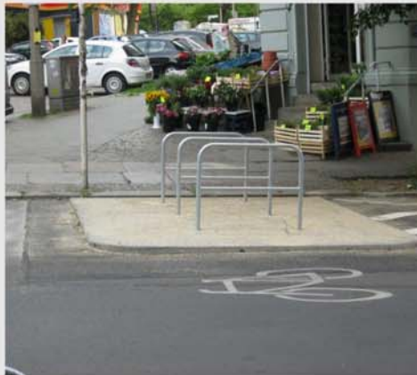
We have to reallocate space...