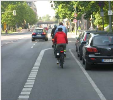
New ideas: Reallocation of space for cycling...